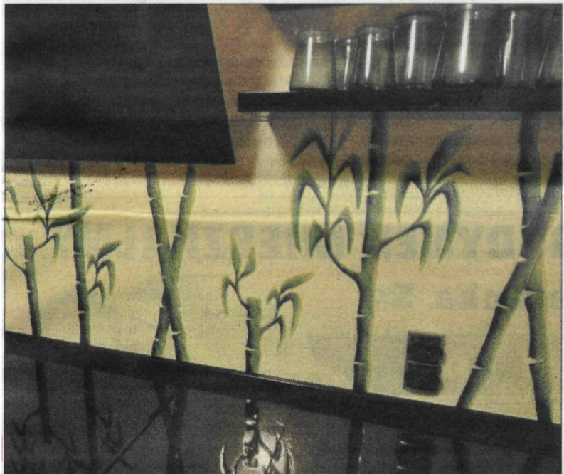
Eleganckie panele ściennie do zastosowania w kuchni