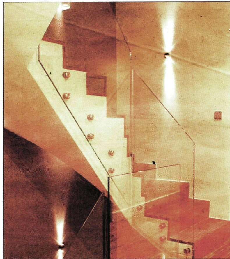
Do produkcji szklanych schodów czy balustrad używa się szkła warstwowego i laminowanego

Szklane konstrukcje wybieramy ze względu na możliwość odpowiedniego naświetlenia pomieszczenia, dzięki przepuszczalności światła przez szklaną taflę. Metoda fusingu dodatkowo pozwala stworzyć pożądany wzór i kolorystykę, a tym samym sami możemy wyregulować naświetlenie wnętrza. Do